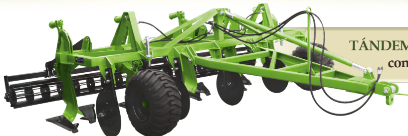
TÁNDEM DPT 540 MA con rodillo nivelador