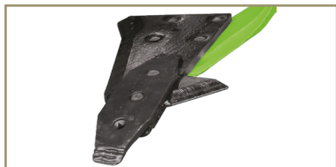
Opcional: Puntera Tándem (Suelos Pesados)